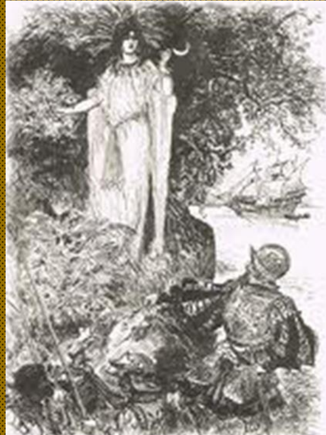
La mama coca, Ilustración de la edición francesa de M. Mortimer, l'histoire de la coca, 1904.

La coca tiene numerosas propiedades medicinales. Observa el documento presentado por el profesor y la imagen a continuación.